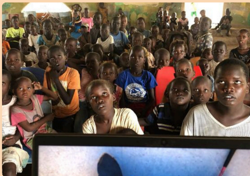
Aquí podéis ver el nivel de absorción de los niños viendo los cortos de Pixar.