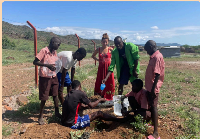
Plantando árboles en marzo para verlos crecer en Abril!

Creemos que el cine es una forma amena y entretenida de aprender; de abrirnos a otros mundos, de mejorar en el idioma y de crecer en valores.